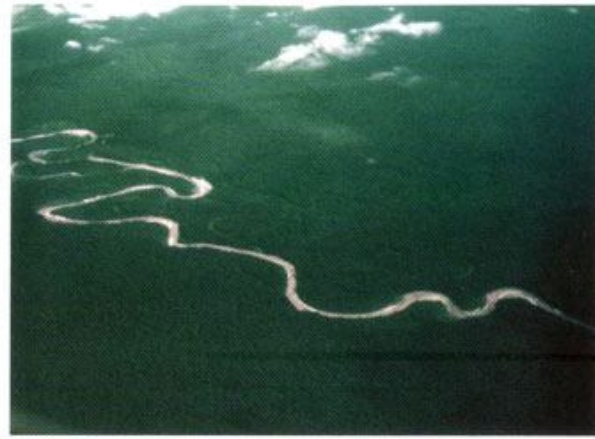
En sentido horario: vista del río Madre de Dios desde el aire. Para dormir en un árbol se cuenta con todas las comodidades. El Canopy Tree House es la estrella del lodge.