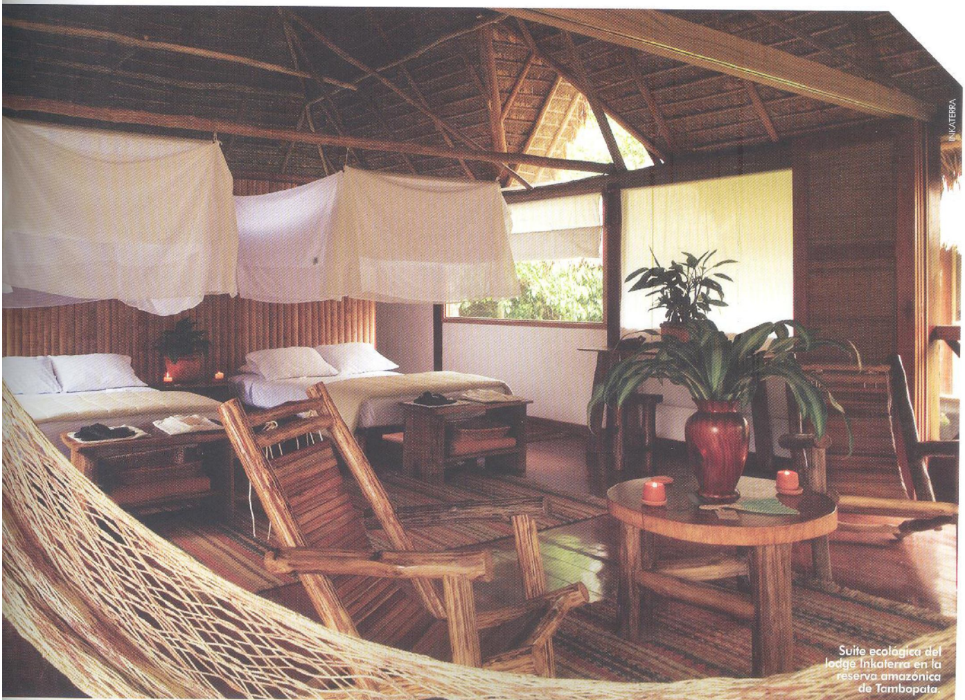
Suite ecológica del lodge Inkaterwa en la reserva amazónica de Tambopata.

"EN EL TURISMO DE LUJO EL COSTO DE CONSTRUCCIÓN POR CADA HABITACIÓN ESTÁ POR ENCIMA DE LOS US$300.000 O US$350.000. HAY OTRAS CADENAS QUE LLEGAN A CASI UN MILLÓN DE DÓLARES POR HABITACIÓN, Y LAS VAMOS A TENER EN EL PERÚ".