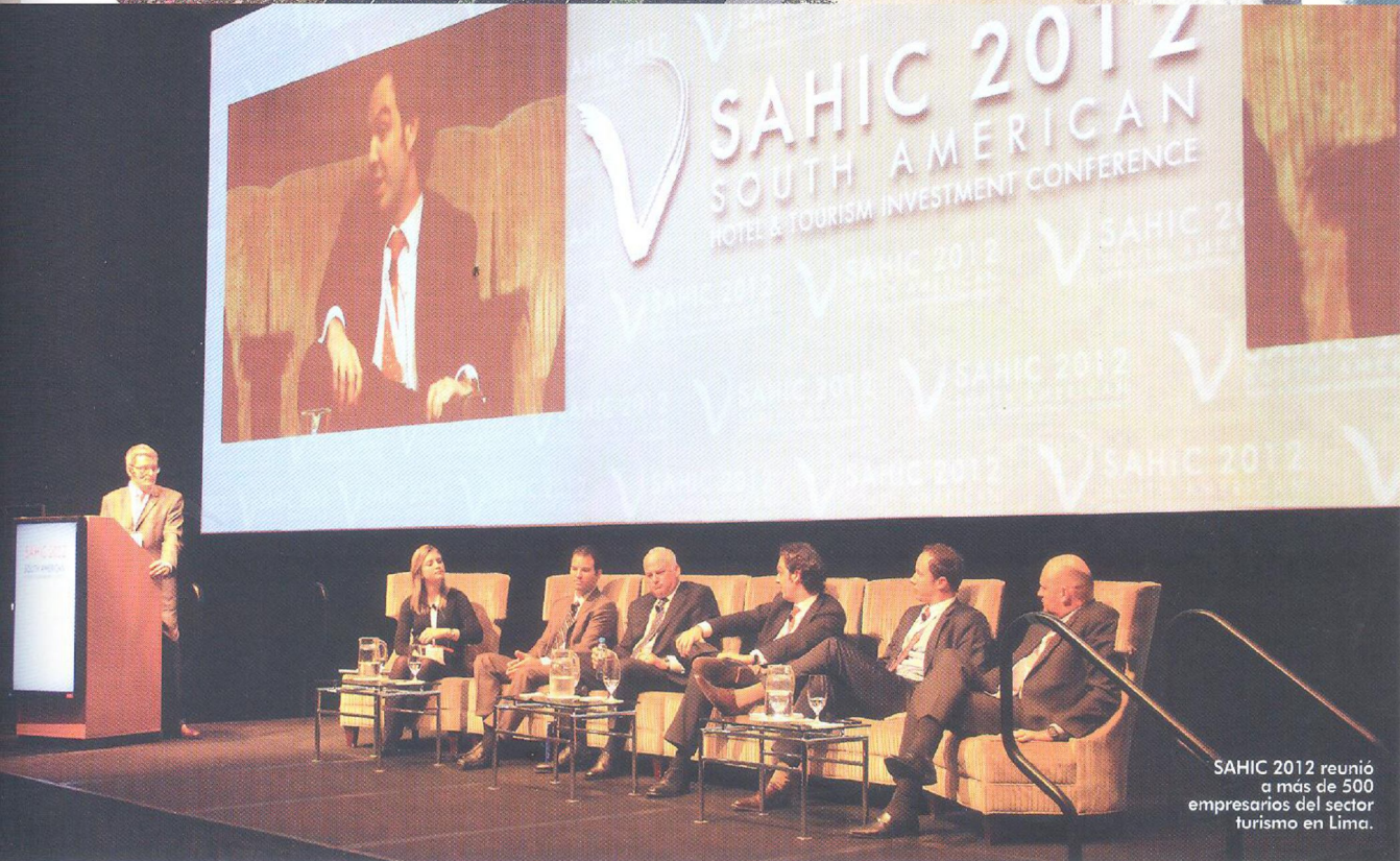
SAHIC 2012 reunió a más de 500 empresarios del sector turismo en Lima.