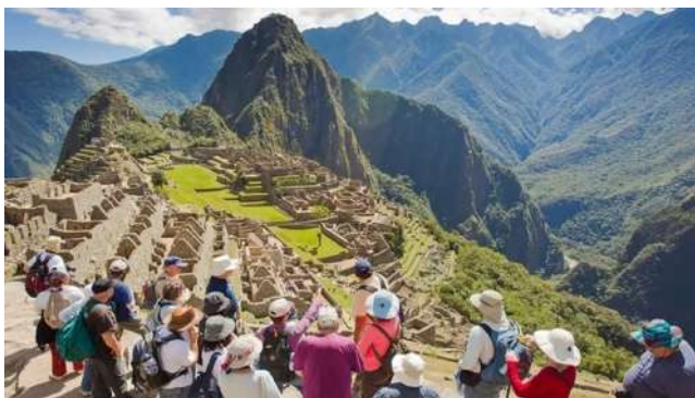
Machu Picchu en Perú.

"Todos los que desempeñamos algún papel en el sector público o privado tenemos la responsabilidad de asegurar que los beneficios económicos generados se encuentren acompañados de una gestión sostenible", agregó.