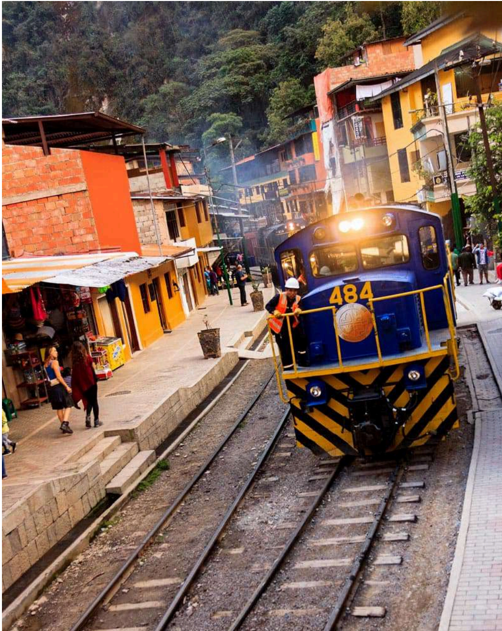
TREN HACIA AGUAS CALIENTES

Cada una de estas rutas ofrece una experiencia única, y en Salkantay Trekking estamos aquí para ayudarte a planificar el viaje de tus sueños. ¡Reserva tu trekking con anticipación y prepárate para una experiencia inolvidable!