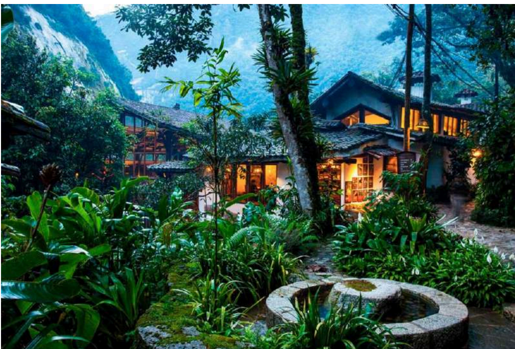
HOTEL INKATERRA – AGUAS CALIENTES

Sea cual sea tu estilo de viaje, Aguas Calientes tiene una opción perfecta para ti. ¡Prepárate para una experiencia inolvidable a las puertas de Machu Picchu.