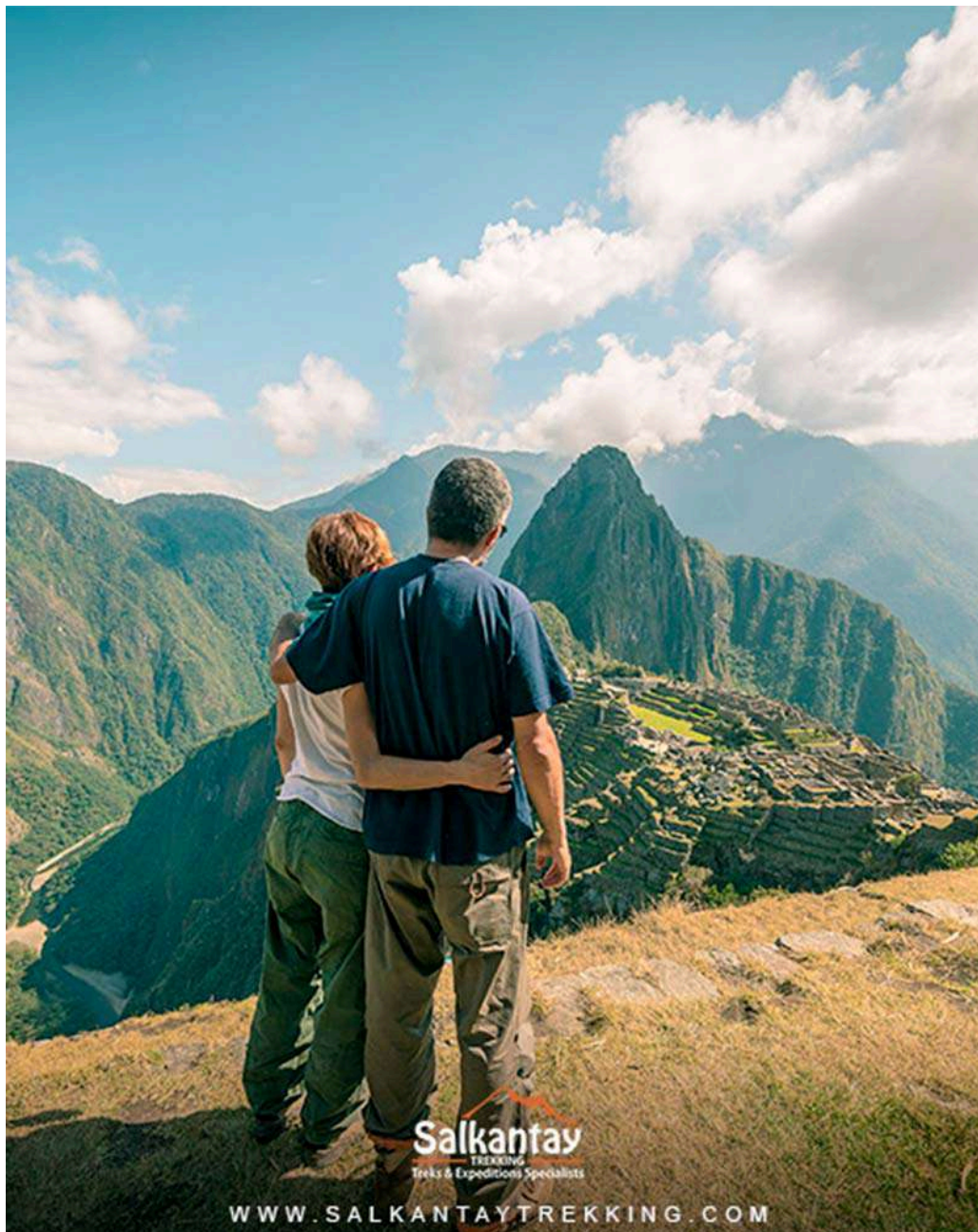
PAREJA OBSERVANDO MACHU PICCHU

El principal atractivo de Aguas Calientes y Perú, Machu Picchu, atrae a 1.5 millones de turistas cada año. Desde este pintoresco pueblo, los visitantes emprenden el viaje hacia la Ciudad Inca, ya sea tomando un bus de 30 minutos o subiendo a pie en una caminata de 2 horas. Además, los más aventureros pueden optar por escalar las imponentes montañas de Huayna Picchu o Machu Picchu , con vistas inolvidables de las ruinas desde ángulos poco conocidos. Huayna Picchu es considerada una de las caminatas cortas más impresionantes del mundo.