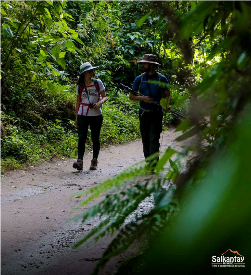
TRAMO DE HIDROELÉCTRICA A MACHU PICCHU