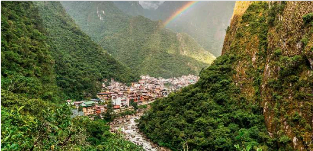
MACHU PICCHU PUEBLO