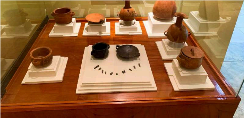
MUSEO DE SITIO MANUEL CHÁVEZ BALLÓN