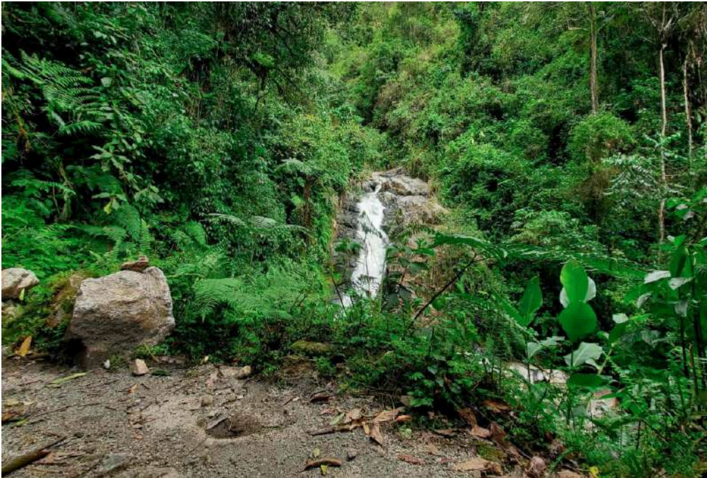
CATARATA DE ALLCAMAYO

Aguas Calientes es mucho más que la puerta de acceso a Machu Picchu; es un destino en sí mismo, lleno de aventuras y lugares por descubrir. Desde caminatas desafiantes hasta momentos de relajación en las termas, este pequeño pueblo tiene algo que ofrecer para todos. ¡Prepárate para una experiencia inolvidable!