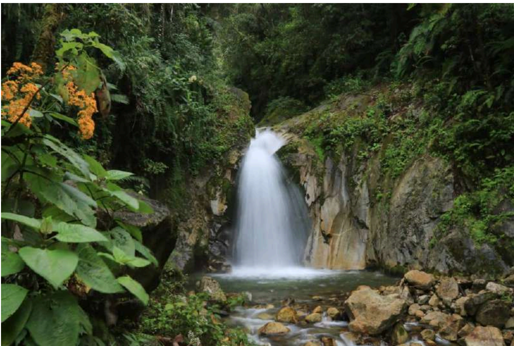
CATARATA DE MANDOR

A tan solo 1 hora de caminata desde Aguas Calientes, los Jardines de Mandor son un oasis ecológico que ofrece una inmersión en la biodiversidad local. Aquí podrás caminar entre exuberante vegetación, incluyendo orquídeas, helechos y begonias, mientras disfrutas del canto de aves y el vuelo de mariposas. Al final del recorrido, te espera la espectacular Catarata de Mandor , un rincón perfecto para los amantes de la naturaleza.