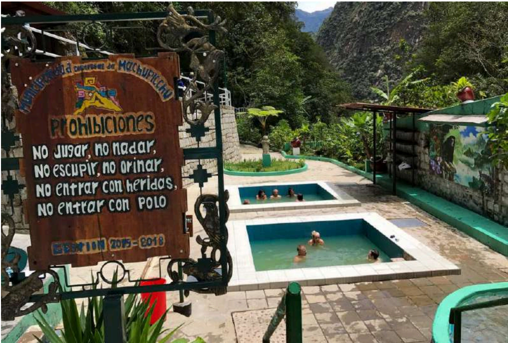
AGUAS TERMALES DE AGUAS CALIENTES