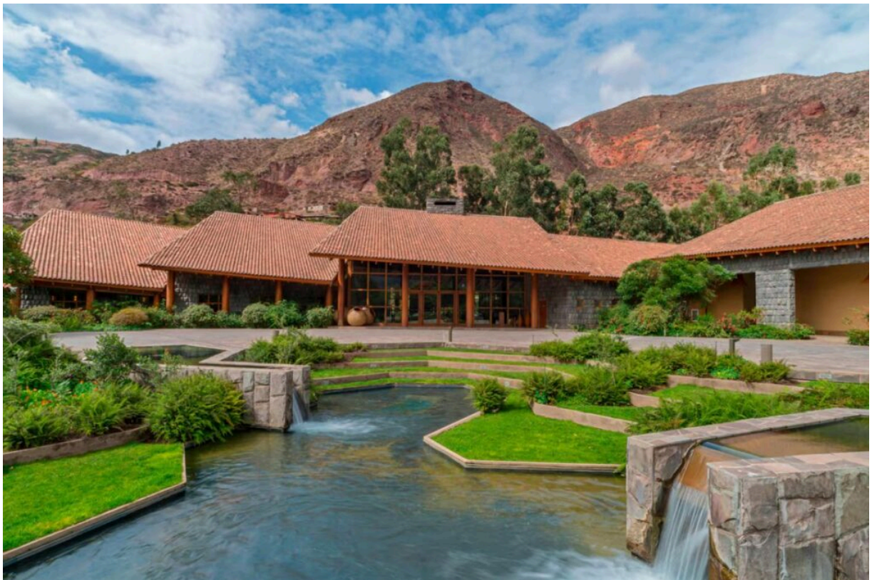
Tambo del Inka, a Luxury Collection Resort & Spa

En el corazón del Valle Sagrado, Tambo del Inka es mucho más que un hotel: es un refugio que conecta al viajero con la naturaleza y la cultura andina. Este es uno de los mejores hoteles para alojarse en Perú si deseas explorar Machu Picchu, ya que cuenta con su propia estación de tren. Además, sus servicios de spa y gastronomía basada en ingredientes locales son insuperables. Las habitaciones combinan diseños modernos con detalles inspirados en la cultura incaica, ofreciendo vistas espectaculares al río Vilcanota. No te pierdas sus caminatas guiadas por el Valle Sagrado, una experiencia que te conecta profundamente con la naturaleza.