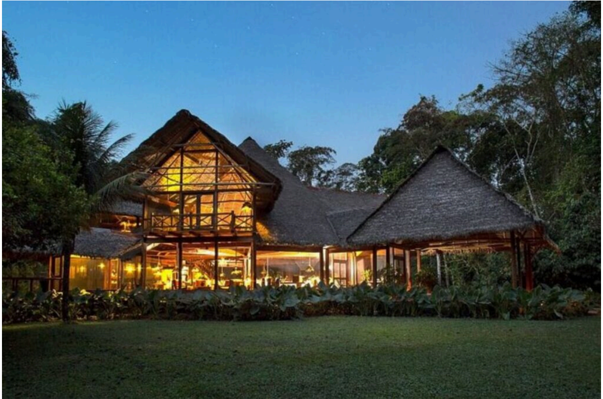
Inkaterra Reserva Amazónica

ofrece experiencias educativas sobre la flora y fauna de la región, perfectas para familias y amantes de la naturaleza.