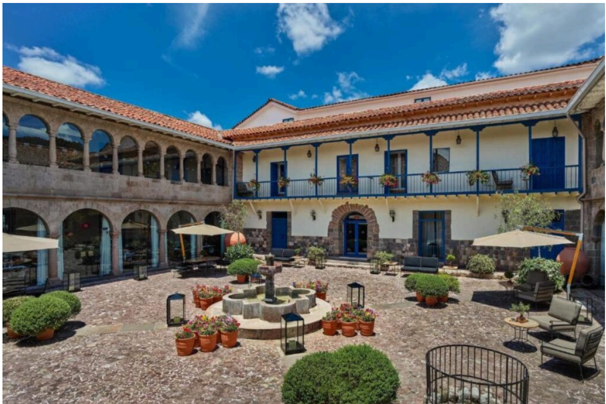
Palacio del Inka, a Luxury Collection Hotel

que buscan una experiencia inmersiva. Entre sus servicios destacados está su spa inspirado en rituales incas, que incluye tratamientos a base de ingredientes locales como la quinua y la coca.