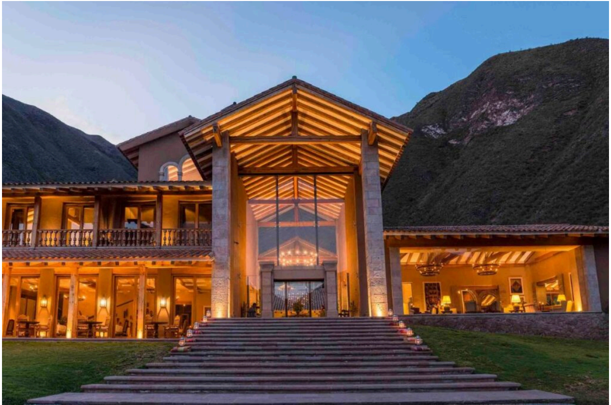
Inkaterra Hacienda Urubamba

actividades locales como la cosecha de alimentos, mientras disfrutan de comodidades de lujo como spas al aire libre y cenas bajo las estrellas.